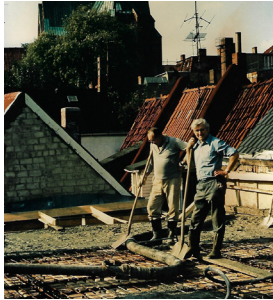
1982 Bau kl. Saal Decke