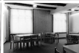
07.09.1985 neue Räume Hundestr. & kl. Saal