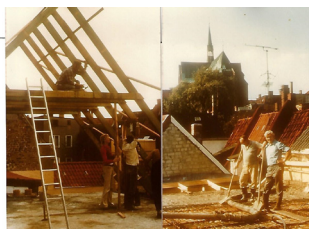
1982 Bau kl. Saal OG und Dach