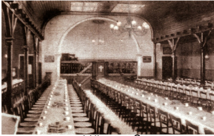
1900 Huxstraße 115 Einweihung 400 Sitzplätze