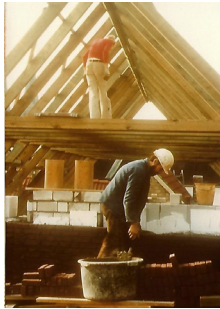
1982 Bau kl. Saal OG und Dach