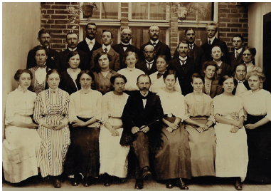
1912 Gem. Chor