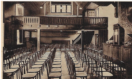
25.08.1925 Einweihung Saalanbau