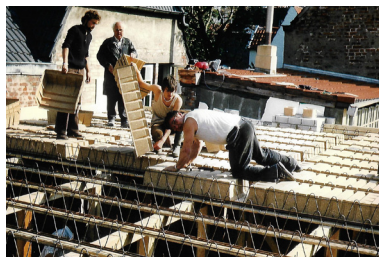
1982 Bau der Decke kleiner Saal