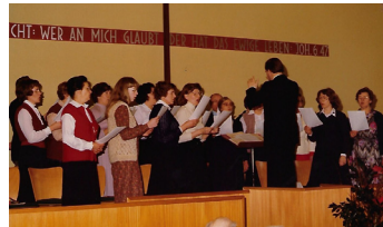
1957 Saaleinweihung Chor