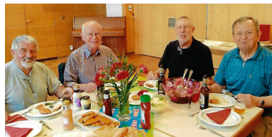
06.07.2017 Auflösung Posaunenchor