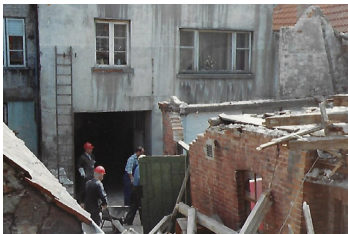
1981 Hof Hundestr. Beginn Abbrucharbeiten