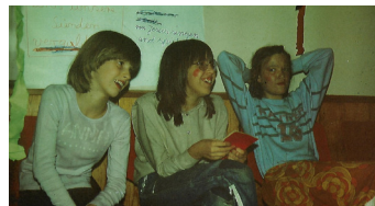
ca. 1980 Kinderfreizeit Holthofsbostel