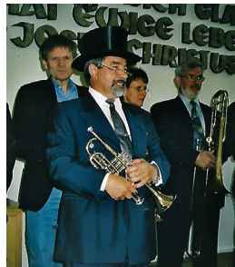
August 2003 50-jähriges- Bläserjubiläum