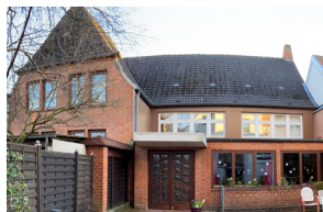
März 2022 Außenansicht Saal