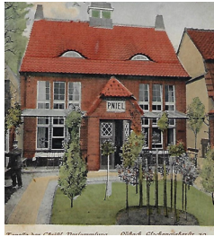
1912 Außenansicht Gem. Pniel